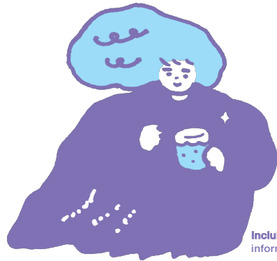
IncluDE / information card_4