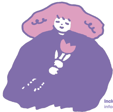
IncluDE / information card_6