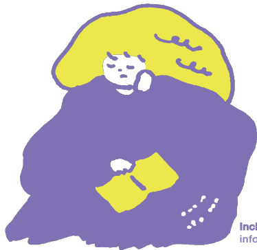
IncluDE/ information card_5